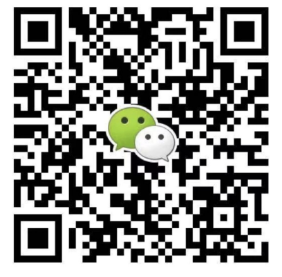
● 华北华东地区及海外咨询 滕老师