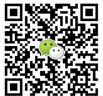
● 华北华东地区及海外咨询 滕老师