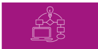
AP Computer Science Principles

Administered on same schedule as corresponding paper exams.