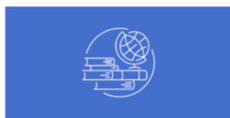
AP World History: Modern