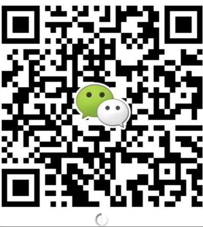
● 华南地区及海外咨询 叶老师