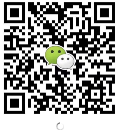
● 华北华东地区及海外咨询 滕老师