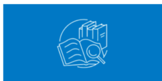
AP English Literature and Composition