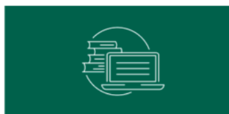
AP English Language and Composition