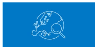
AP European History