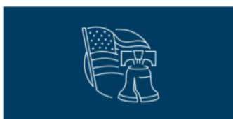
AP U.S. History